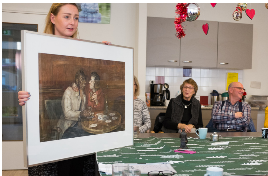
Charles Kemper – 'Interieur Café' (1968).

Harrie: 'Beroepsmatig contact heeft zij met hem. Ik heb het nog nooit zo netjes uitgedrukt. Het kan natuurlijk zijn dat ze later nog meer contacten in het café heeft.'